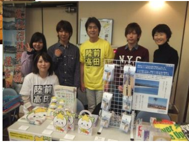
速水けんたろうさんとスタッフ